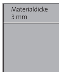
umlaufender Rahmen mit waagerechten Trennprofil

Sie haben die Möglichkeit die Schildflächen mit Hilfe von Trennprofilen 10/6 zu unterteilen (horizontal und/oder vertikal). Nebenstehend zeigen wir Ihnen einige Beispiele.