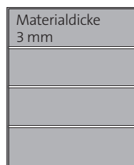
umlaufender Rahmen mit mehreren waagerechten Trennprofilen